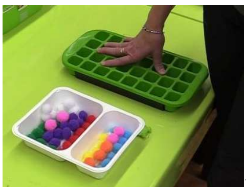
Fig. 2 : Le matériel de l'activité Glaçons