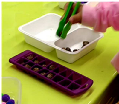
Fig. 1 : Jeu d'une élève de 1-2H

Lors de cette période de jeu libre, les élèves avaient accès à l'ensemble du matériel de la classe (épicerie, jeux de société, puzzles ...) ainsi qu'à un certain nombre de matériels disposés par l'enseignante dans la classe, par exemple des plateaux avec des billes plates, des boîtes d'œufs ou encore des bacs à glaçons avec des pompons. Comme dans toute phase de jeu libre, aucune consigne sur l'usage de ce matériel n'avait été fournie aux élèves. Ce faisant, aucun objectif préalablement anticipé par l'enseignante n'avait été communiqué aux élèves.