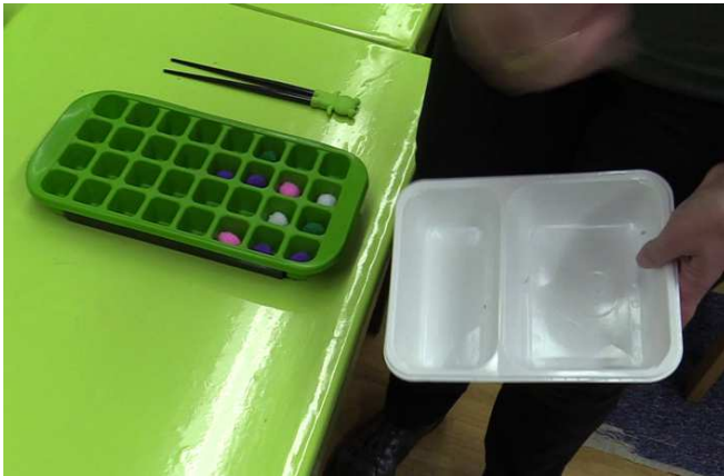
Fig. 5 : Remplissage du bac à glaçon avec les pompons

11 plus pouvoir prendre une poignée. Parce qu'il ne faut pas que je prenne plus. Donc je me dis je vais 12 encore prendre trois là pour...ok. (va en chercher trois). [...] Un, deux, trois. Là je suis sûre de pas 13 prendre plus. Là je mets mes trois. Ah il ne me reste plus qu'une ligne (Fig. 6). Euh. Bah je vais 14 arriver dans le dénombrement. Un, deux, trois quatre et je vais chercher : j'ai quatre et j'ai gagné. [...]