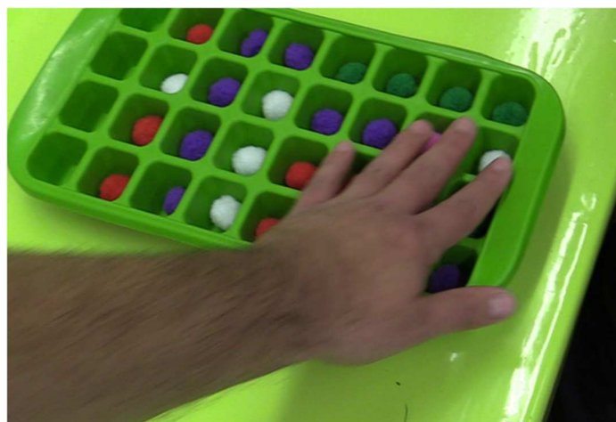
Fig. 7 : Désignation de l'observateur

15 I 1 : Pourquoi tu forcerais pas ça avant ? C'est-à-dire, par exemple, quand l'élève a rempli cette zone- 16 là (Fig. 7) pourquoi ne pas forcer l'affaire en disant : « maintenant vous ne faites plus qu'un seul 17 voyage » ou des choses comme ça ?